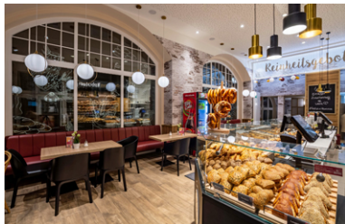
AIC Nahrstedt 2.jpg

Das Backhaus Nahrstedt setzt am Standort Karlstraße 1 in Eisenach neben dem Snackangebot vor allem auf die sicht- und erlebbare Brotkompetenz.